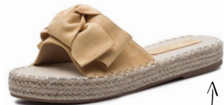
PANTOFLE CCC DEEZEE