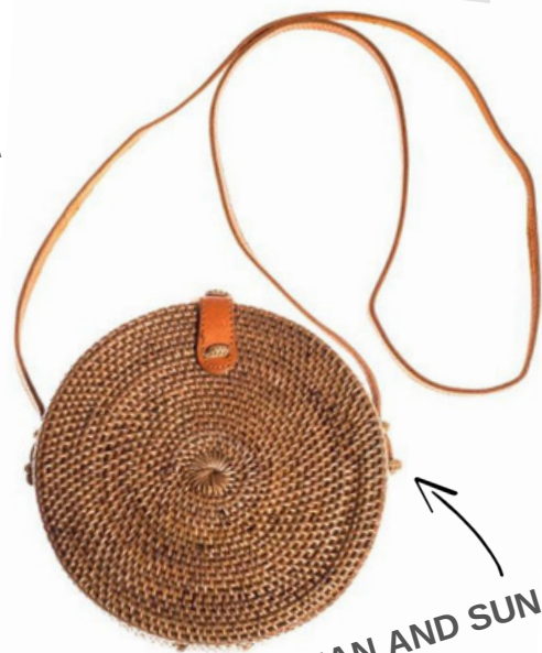
KABELKA OCEAN AND SUN