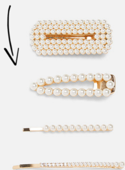
SPONKY S PERLAMI ZARA

Léto není jen o sluníčku a dovolené, je i o krásných šatech, botách a skvěle padnoucích doplňcích. Já si pro vás připravila několik tipů, kterými můžete vylepšit váš letní outfit.